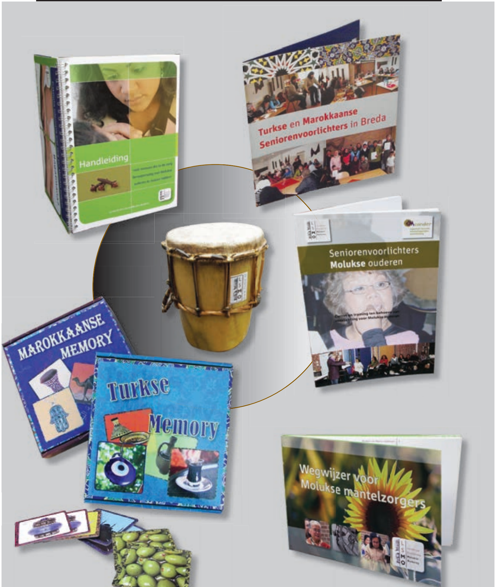
Een overzicht van werkzaamheden in 2009 en 2010