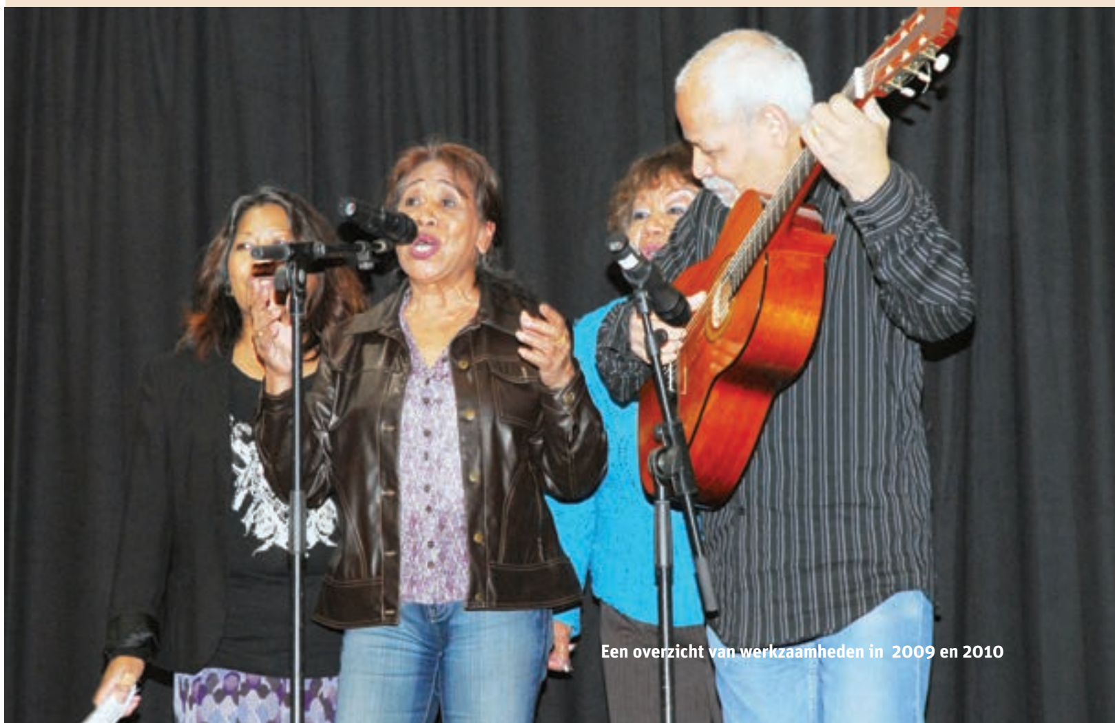
Een overzicht van werkzaamheden in 2009 en 2010

Het zoeken naar mogelijkheden om het reguliere zorgaanbod en de wensen van Molukse ouderen zo dicht mogelijk bij elkaar te brengen.