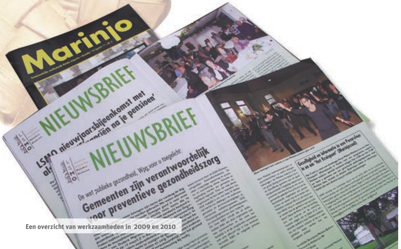
Een overzicht van werkzaamheden in 2009 en 2010

Naast voorlichting over de AWBZ bezuinigingen is onder andere ook voorlichting gegeven over de AOW, de mogelijkheden om deel te nemen aan verzorgde reizen als die van het Rode Kruis en het versterken van lokale netwerken door samen te werken met partners in zorg en welzijn. Het jaar 2009 begon met een LSMO-nieuwjaarsreceptie waar voorlichting werd gegeven over het belang van het lidmaatschap en de registratie.