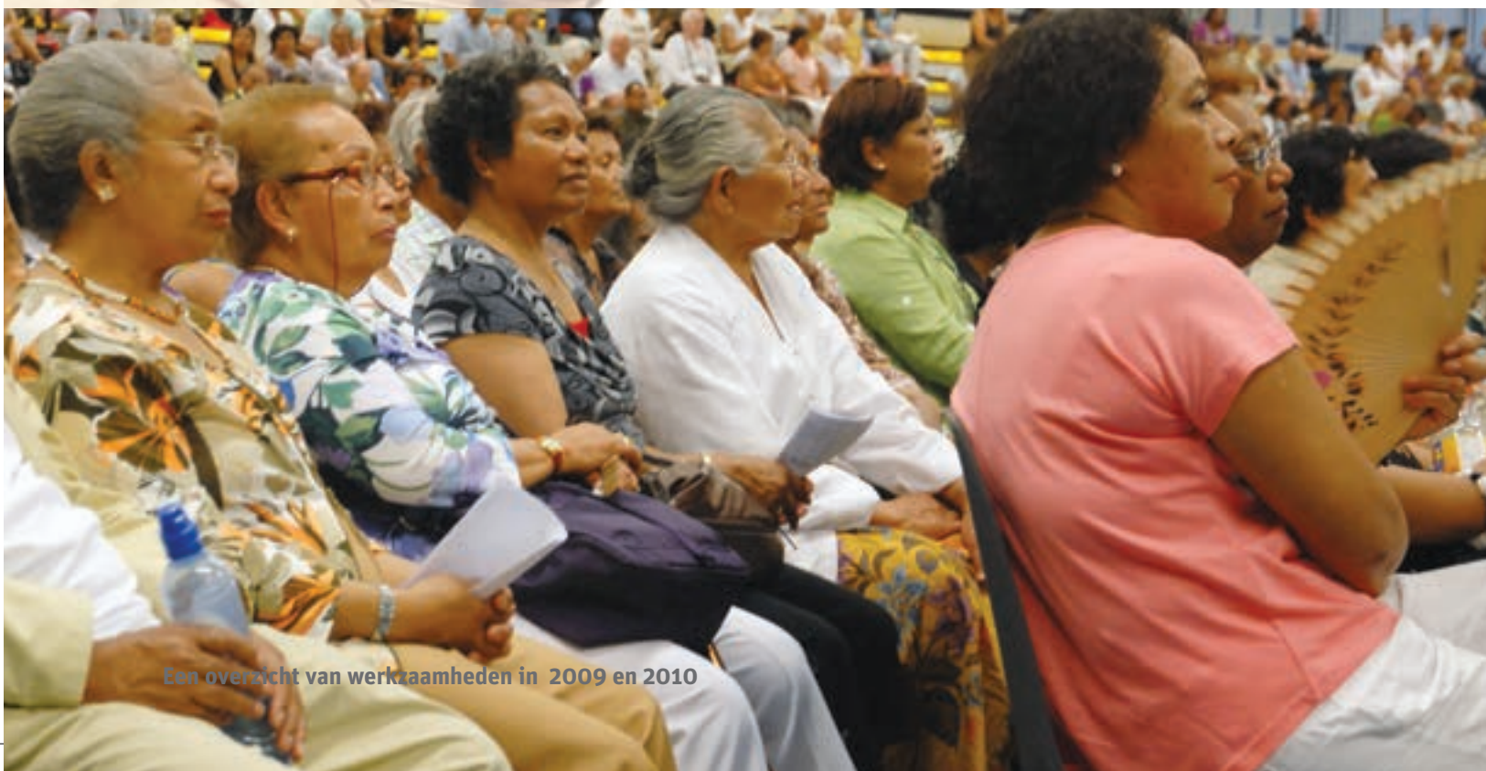
Een overzicht van werkzaamheden in 2009 en 2010

Stichting Buat is het platform voor Molukkers dat fungeert als direct aanspreekpunt voor de Nederlandse overheid waar het gaat om aan Molukkers gerelateerde zaken. De stichting is één van de samenwerkingsverbanden binnen het Landelijk Overleg Minderheden, het LOM. Twee maal per jaar nodigt Buat landelijke Molukse organisaties uit om actuele zaken te bespreken die spelen binnen de Molukse gemeenschap. LSMO maakt deel uit van dit overleg.