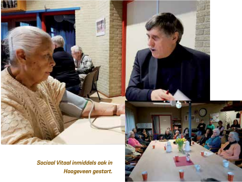
Sociaal Vitaal inmiddels ook in Hoogeveen gestart.

dit project tot en met oktober 2018 uitgevoerd.