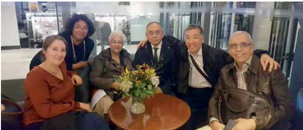
Vertegenwoordigers NOOM en LSMO na diner VWS, onderdeel van het Pact, in Sociëteit De Witte, Den Haag, 26 september 2018

Nadenken over het ouder worden is nodig in een samenleving waarin sprake is van vergrijzing en uitgegaan wordt van de voorbereidingen die je zelf moet treffen voor de oude dag. Alleen gaat dat 'zelf voorbereidingen treffen' nog niet helemaal naar ieders wens. Eenzaamheid onder ouderen komt te vaak voor, ouderen moeten langer thuis kunnen blijven wonen en de kwaliteit van de verpleeghuiszorg kan nog steeds beter. Om deze drie thema's de komende jaren aan te pakken, heeft het Ministerie van Volksgezondheid, Welzijn en Sport het Pact voor de Ouderenzorg opgesteld. Het Pact is op 8 maart jl. ondertekend door Minister Hugo de Jonge en ruim 35 verschillende organisaties, waaronder ook het Netwerk van Organisaties van Oudere Migranten, dus indirect ook door LSMO, daar LSMO lid-organisatie is van NOOM. Het Pact begint met een citaat uit het manifest 'Waardig Ouder Worden': 'Wij geloven in een samenleving waarin ouderen zich gezien en gewaardeerd voelen. Een samenleving waarin zij goede zorg en liefdevolle aandacht krijgen, gewaardeerd worden om wie ze zijn en waarin zij kunnen blijven meedoen'. Als wij nou eens proberen om 'Lain Lihai Lain' hierin tot uiting te laten komen. Zouden we dan niet eerder naar elkaar omkijken dan op elkaar wachten tot er iemand iets onderneemt?