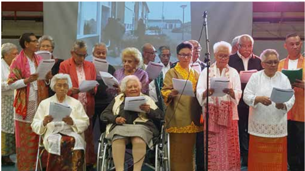
Ouderen zingen tijdens jubileum 10 jaar Rumah Orang Tua Tua.