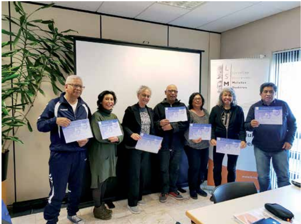
Molukse seniorenondersteuners in Lunteren met certificaat

uitvoering overgegaan kon worden maar dit jaar werd dan toch de scholing uitgevoerd in Lunteren. Het huidige zorgstelsel kwam aan bod, de taken van een seniorenondersteuner, vergelijkbaar met die van een onafhankelijke cliëntondersteuner kwamen onder de aandacht en communicatie en bejegening kwamen aan de hand van rollenspellen aan de orde. Na daadwerkelijk huisbezoeken afgelegd te hebben en hiervoor een handreiking te hebben ontvangen, werden tijdens een tweede dag de bevindingen uitgebreid besproken en eventueel vervolgstappen voorgesteld. De volgende scholing staat gepland in Venlo en mogelijk in Assen. Heeft u belangstelling voor deze scholing? Laat het ons weten. Vrijblijvend bespreken we dan met u de mogelijkheden.