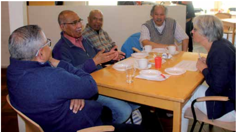
Met elkaar in gesprek over gezondheid en ziek zijn in Woerden.

Alles is Gezondheid en Mijn Kwaliteit van leven zullen ook thema's zijn waar een bijeenkomst over kan gaan. Meer bewegen voor ouderen, gezonde voedingspatronen en nadenken over je sociaal netwerk en woonomgeving, zijn mogelijk onderwerpen voor interactieve workshops. LSMO biedt ondersteuning bij het organiseren van verschillende themabijeenkomsten.