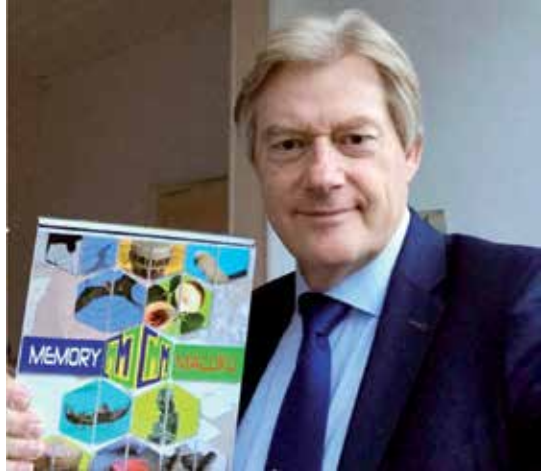
Memory Maluku uitgereikt aan Ladewijk Asscher en Martin van Rijn.