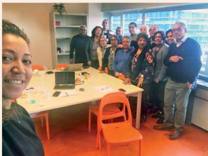
LSMO bestuur, adviseurs en regiocoördinatoren.