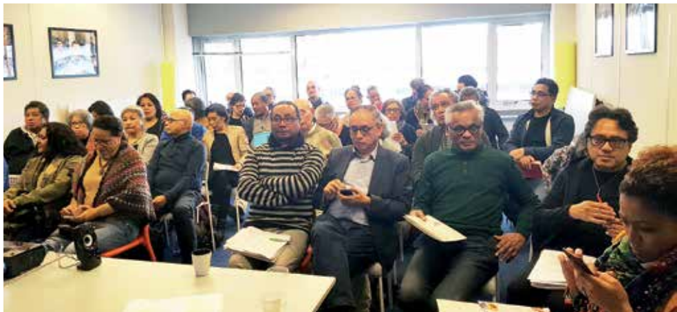
Vertegenwoordigers Molukse ouderenwerkgroepen –van Assen tot Zeeland en Maastricht- op 4 maart bijeen.

Vorig jaar sloot LSMO het jaar af met een, inmiddels traditioneel geworden, Molukse Mantelzorgdag. Die dag werd tevens stilgestaan bij het 20 jarig bestaan van de Stuurgroep. Over verschillende onderwerpen is toen gesproken en duidelijk werd onder andere dat er behoefte is om de ideeën van het studieweekend eind 2015, om te zetten in concrete stappen. In dat weekend is uitgebreid gesproken over een werkverdeling in regio's. LSMO is van een stuurgroep uitgegroeid tot een netwerk van vrijwilligers, verspreid over ruim 30 werkgroepen in het land, bij elkaar meer dan 300 vrijwilligers, die actief zijn in het ouderenwerk. De vragen nemen toe, worden ingewikkelder, de vrijwilligers krijgen steeds meer taken en willen op de hoogte gehouden worden van de actuele ontwikkelingen met betrekking tot zorg en welzijn. Kortom, de ontwikkelingen vragen om een andere verdeling van het werk.