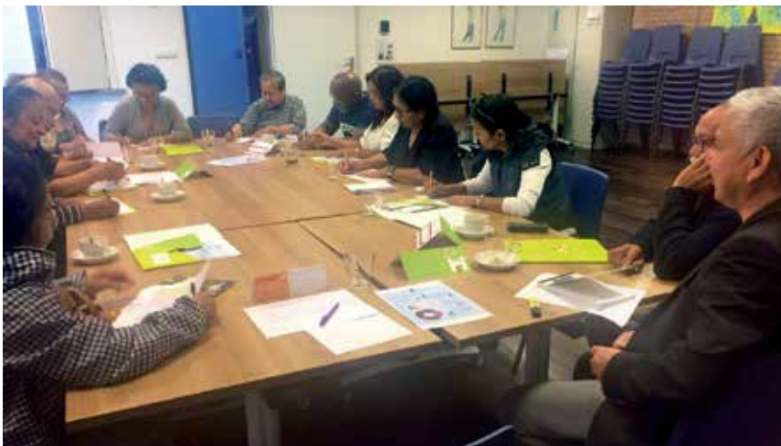
Dialoog met ouderen, vrijwilligers en mantelzorgers in Weert.