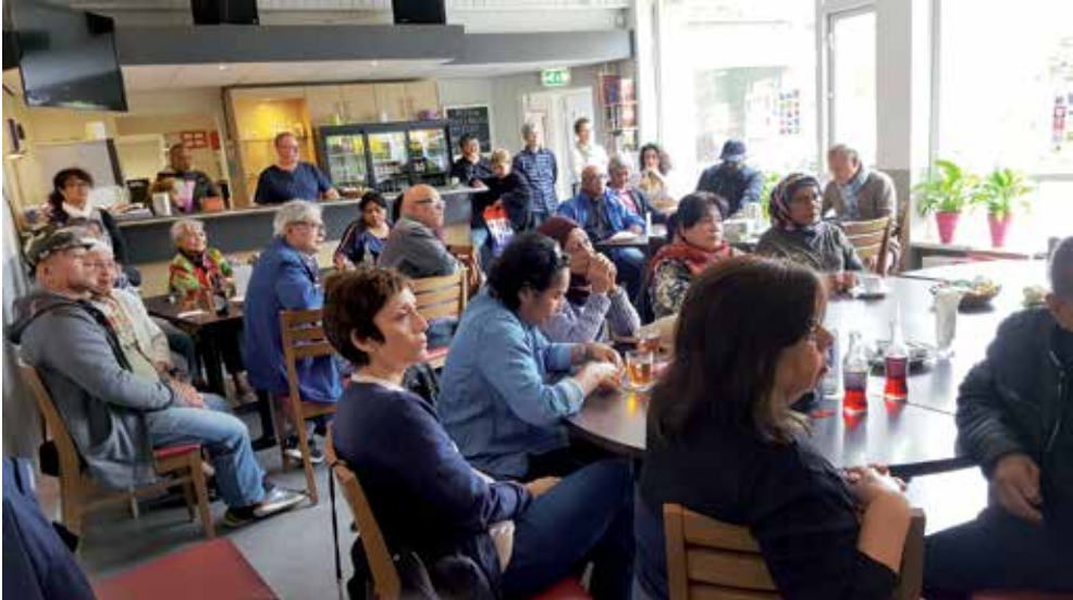
In gesprek met Indische en Molukse ouderen in Waalwijk.