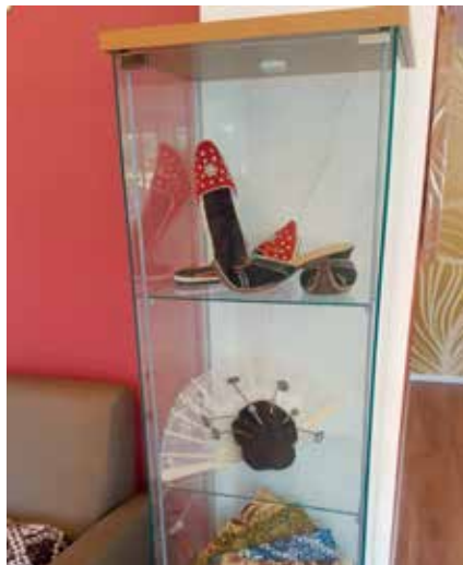
Ouderen worden naar Bunga Tjenke begeleid. Molukse attributen in de huiskamer.